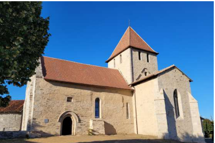
Eglise de Lageyrat, rénovée en 2022, à 800 m du point 8 au village de Lageyrat, hors circuit.

11 Tourner à gauche et emprunter la RD 6bis sur 200 mètres. Emprunter la Rue Saint Roch sur la droite, avant l'atelier municipal tourner à gauche, traverser la voie verte, et revenir au départ par l'avenue François Robert.