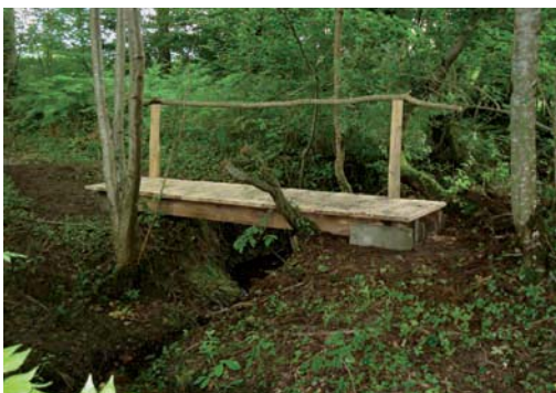
Pont de bois