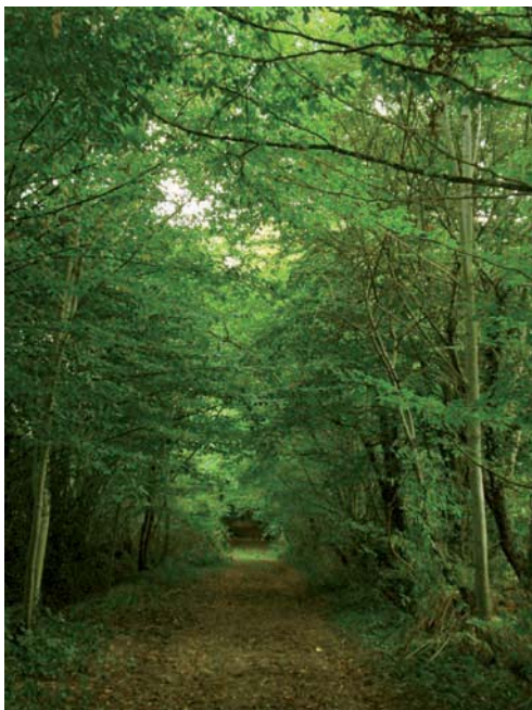
Chemin de la Croix Robert

11 Au croisement, prendre à droite vers le cimetière, traverser la RD et prendre à gauche pour retrouver le parking à 100 m.