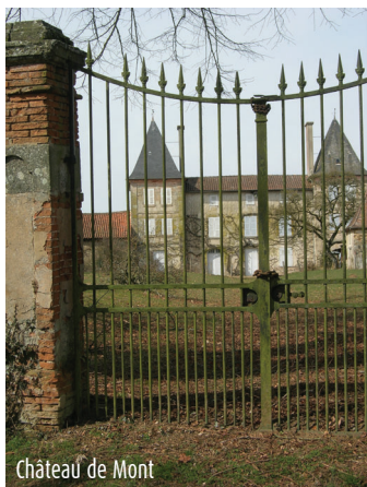
Château de Mont

C'est dans la 1ère moitié du XIIème siècle que fut édifiée la nef de l'église, puis le chœur et le transept, après un incendie en 1178. L'ancien clocher-porche carré a été remplacé par un clocher-mur après son effondrement en 1783. Elle sera ruinée à nouveau au XVIème siècle lors des guerres de Religion et les révoltes paysannes. L'abbaye se relèvera au XVIIème siècle et l'abbatiale retrouva sa fonction en 1635. (Source : Haute-Vienne Tourisme)