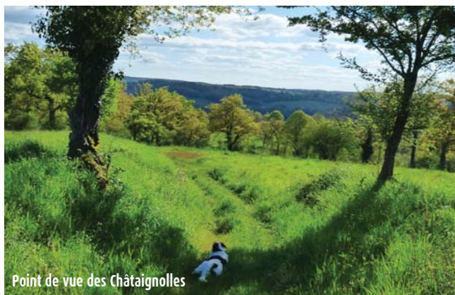
Point de vue des Châtaignolles

Les armoiries de Saint-Victurnien se blasonnent ainsi : De sinople au buste de Saint Victurnien chevelé et barbé d'argent habillé de sable posé sur une champagne d'or chargé de trois triangles ondes du champ, adextré d'une roue de moulin de dix huit aubes aussi d'or et senestré d'une harpe du même. (Source Wikipédia)