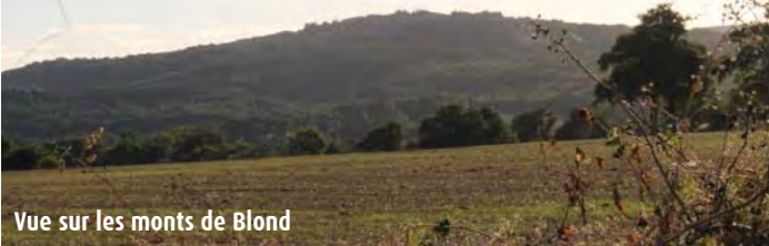
Vue sur les monts de Blond

6 Traverser et aller en face puis poursuivre. A l'angle d'un bois, tourner à gauche et rejoindre la route.