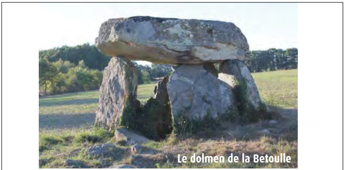
Le dolmen de la Betouille

Breuilaufa La présence des dolmens atteste de la présence d'un peuplement ancien dans les environs sur la commune. D'après certaines traditions, le nom de Breuilaufa viendrait du breuil aux fées, soit la forêt aux fées. La rumeur (ou la légende) veut que deux paysans ont vu un soir des fées dans la forêt de la commune. Il semblerait cependant que la commune doive son nom à son origine latine brilium fagi , désignant un bois de hêtres. Le nom du lieu doit se lire comme "le breuil au fagus", c'est-à-dire, le bois de hêtres. Ses habitants sont appelés les Breuilaufaïes et Breuilaufaïses. (Source Commune)