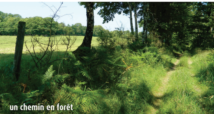
un chemin en forêt