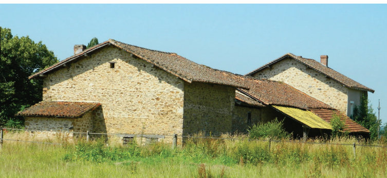
village de Négrelat

Saint-Laurent-sur-Gorre porte le nom d'un des saints les plus vénérés de l'Église romaine : le diacre Laurent martyrisé à Rome en 258. Créée à l'époque mérovingienne, la paroisse a implanté son église près d'un gué sur la Gorre, stratégique depuis la Préhistoire, au croisement de la route du sel, suivie au Moyen-Âge par les pèlerins de Compostelle et de la route des métaux.