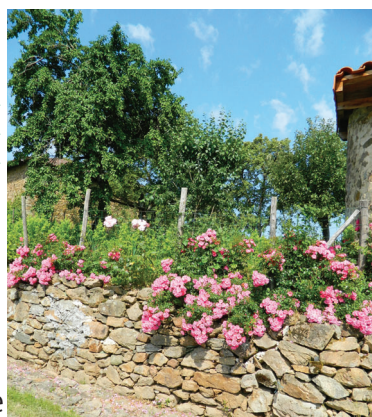
village de la Côte

Le bocage vallonné aux vallées encaissées, qui forme le territoire de la commune, est sillonné de " chemins de crêtes " offrant de multiples points de vue sur l'horizon, de vieux chemins creux qui traversent la campagne en tous sens dont le plus antique matérialisé aujourd'hui par le GR4, de villages et leur patrimoine : puits, fours, clédiers et croix. (source : commune de Saint-Laurent-sur-Gorre et communauté de communes de la Vallée de la Gorre)