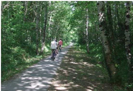
La voie verte des Hauts de Tardoire

La voie verte des Hauts-de-Tardoire relie Châlus à Oradour-sur-Vayres. D'une longueur de 13 kilomètres, elle chemine dans une nature préservée, où rollers, personnes à mobilité réduite, randonneurs, cyclistes, peuvent se promener sur un lieu agréable et sécurisé. La voie Verte est interdite aux véhicules motorisés et aux équestres.