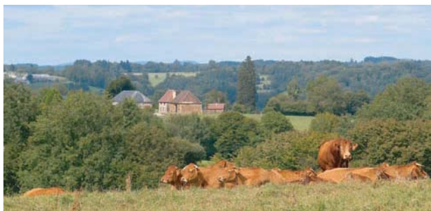
Panorama sur la campagne de la commune de Glanges